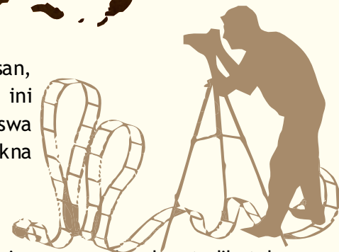
Foto merupakan salah satu media dalam menyampaikan pesan, bahkan foto dapat bercerita. Dengan adanya Lomba Fotografi ini selain untuk mawadahi minat dan bakat siswa-siswi SMA, Mahasiswa dan Pemuda Indonesia, juga bertujuan untuk mendefinisikan makna Pahlawan menurut peserta dalam kehidupan sekarang ini.