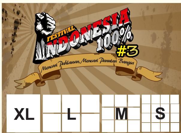
baliho & backdrop